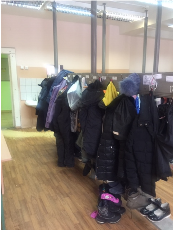
Фото № 13