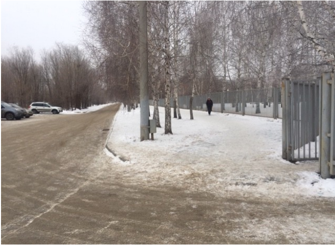
Φοτο Νο 1