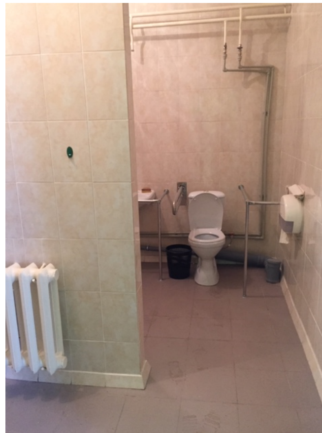
Фото № 20