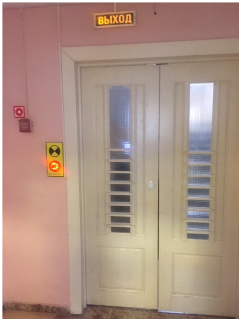
Фото № 25