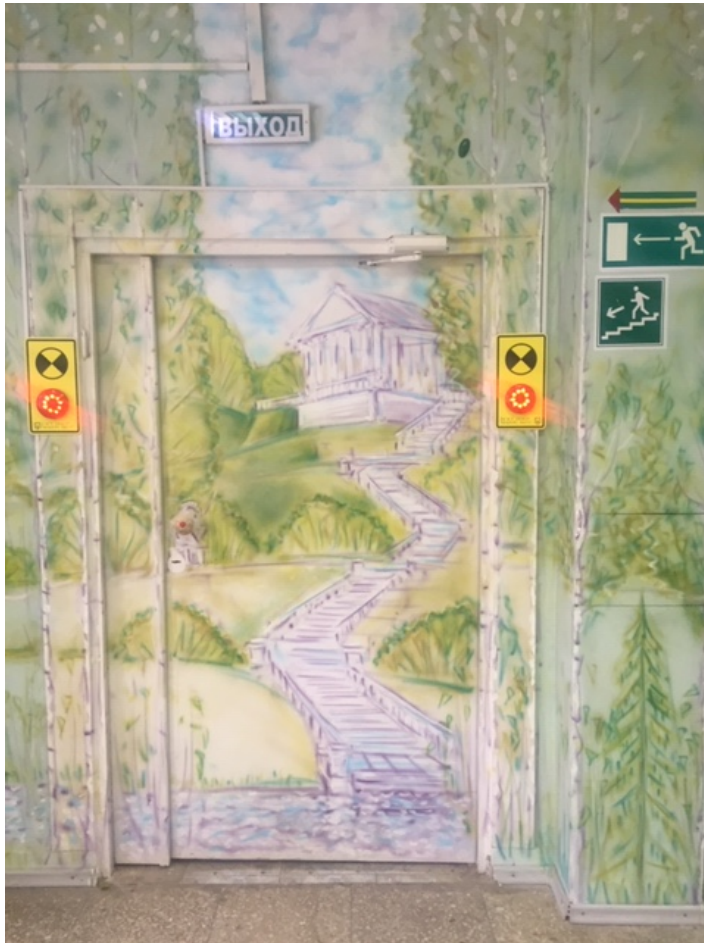
Фото № 21