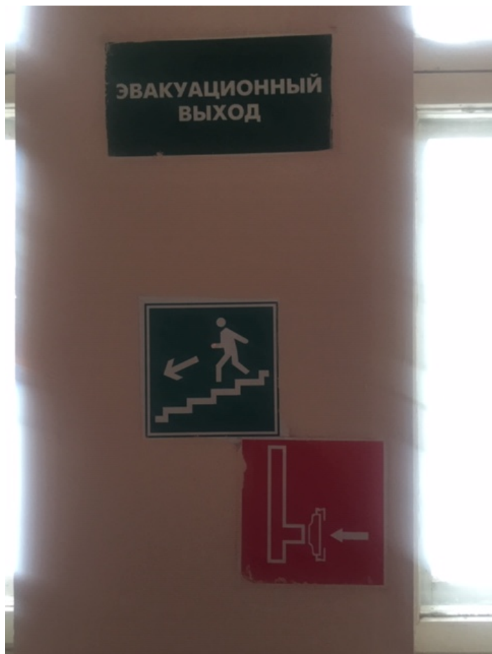
Фото № 23