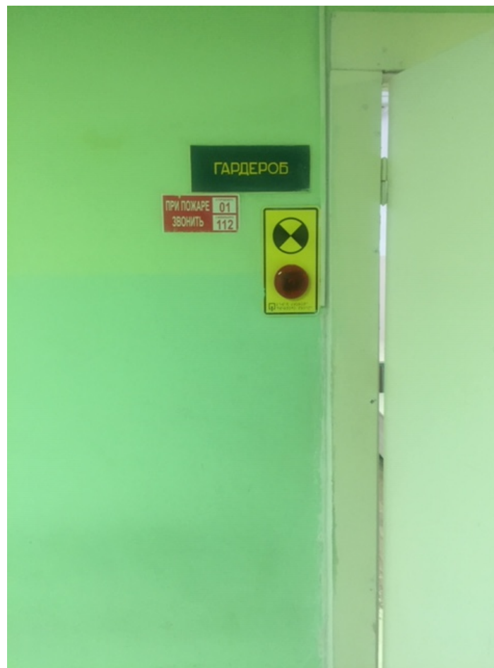
Фото № 24