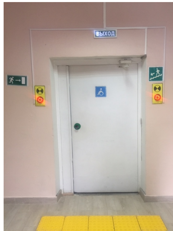
Фото № 12