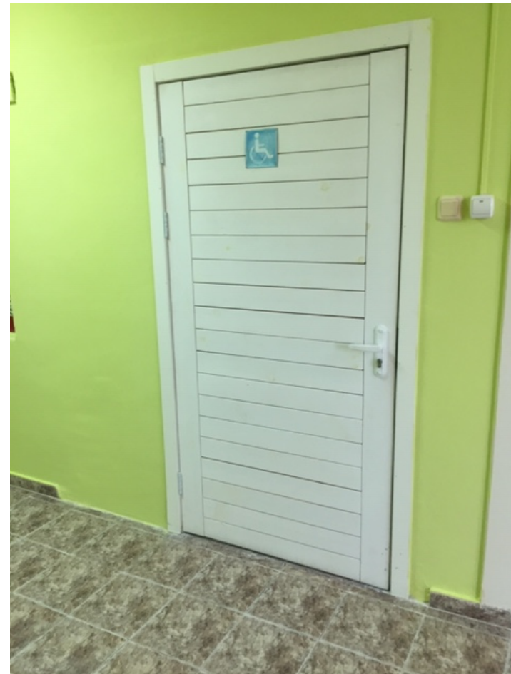
Фото № 18