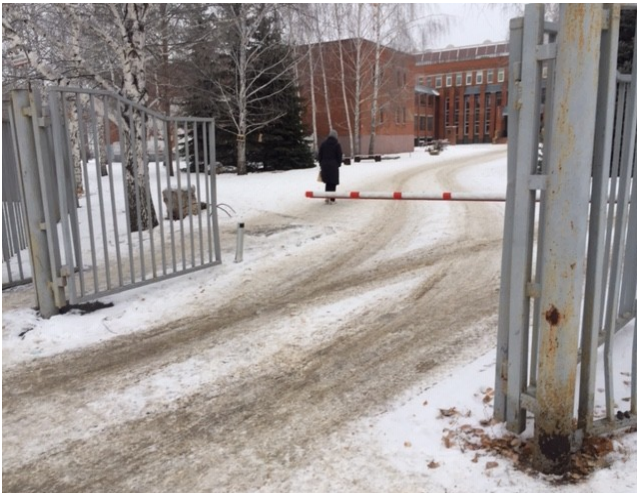
Φοτο Νο 3