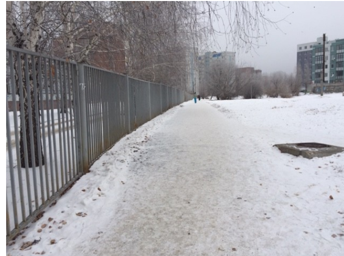
Φοτο Νο 4