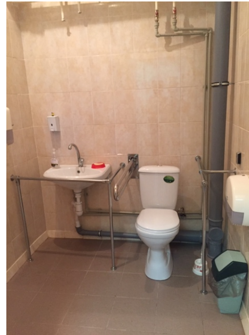
Фото № 16