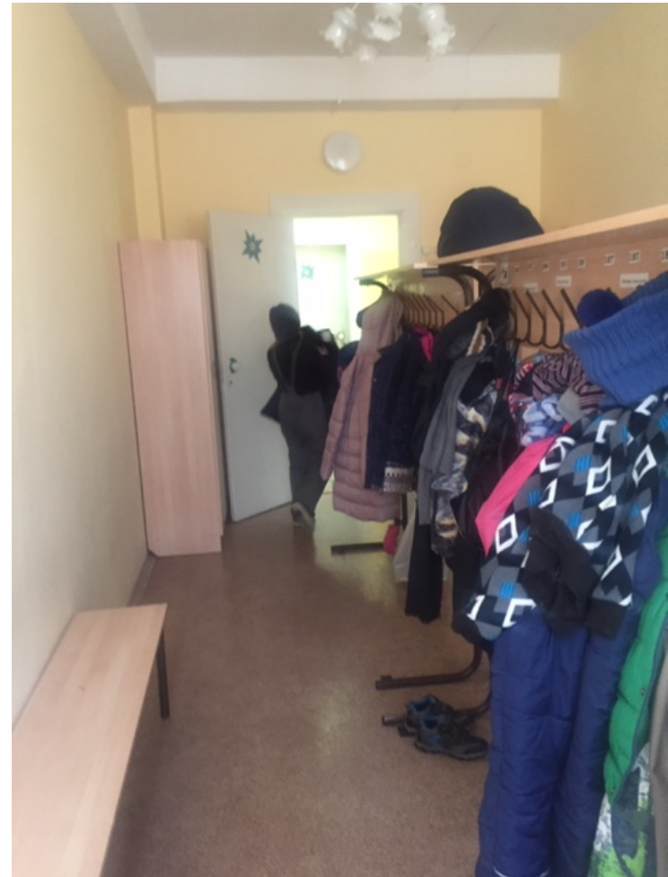
Фото № 14