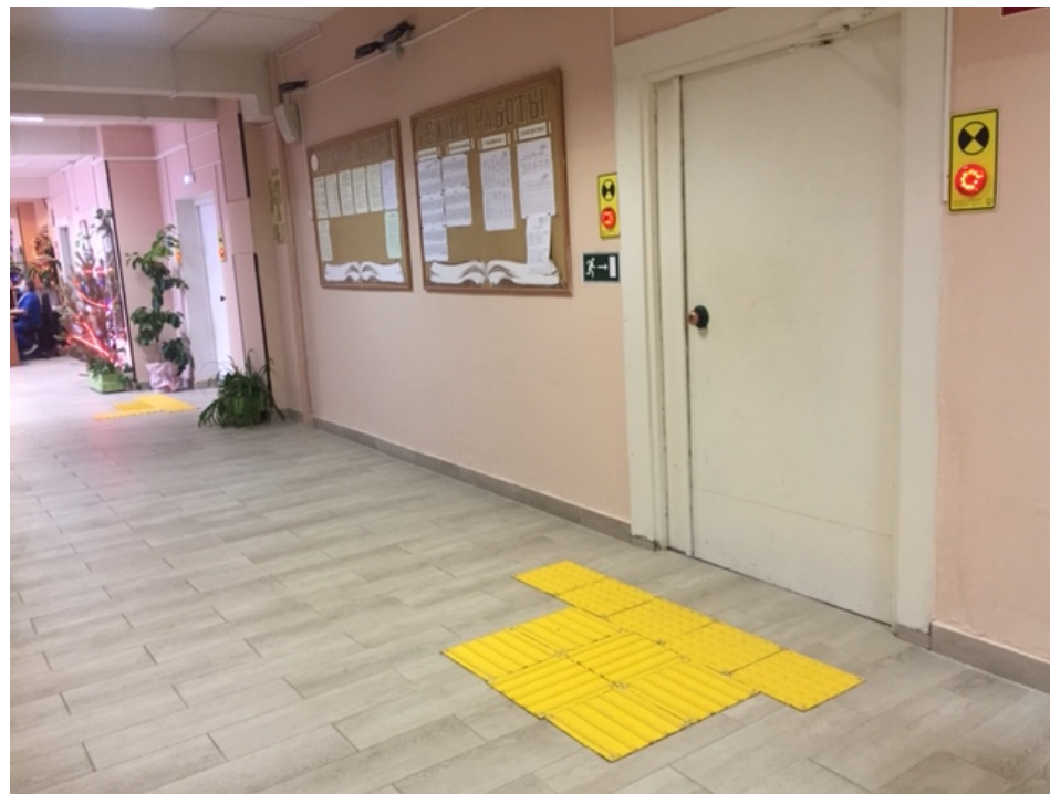
Фото № 10