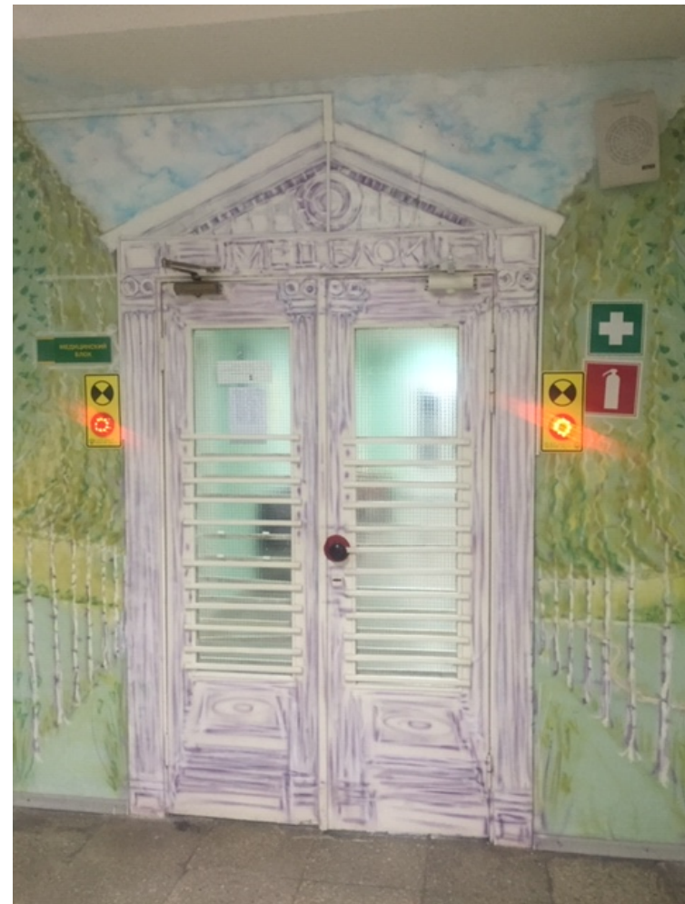
Фото № 22