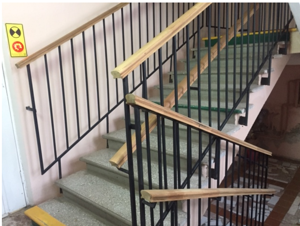
Фото № 11