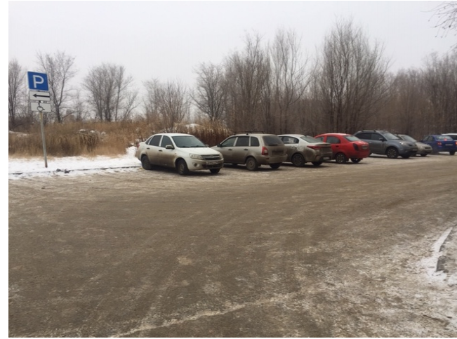
Φοτο Νο 2