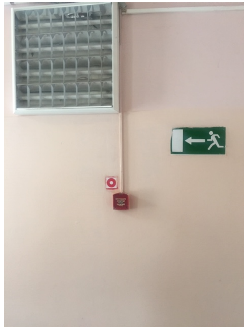
Фото № 26